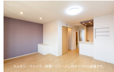
※ルタン・ラシック（多層）シリーズと同タイプのお部屋です。