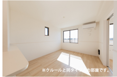
※クルールと同タイプのお部屋です。