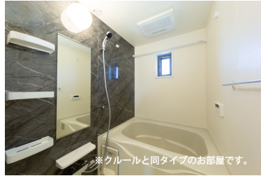
※クルールと同タイプのお部屋です。