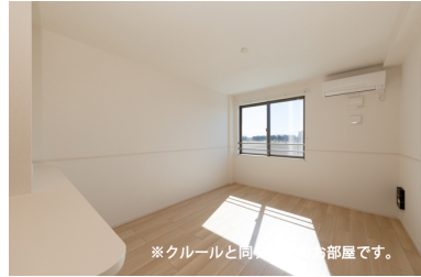
※クルールと同タイプのお部屋です。