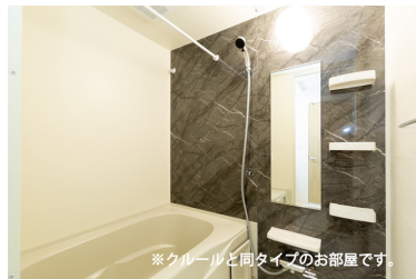
※クルールと同タイプのお部屋です。