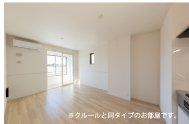
※クルールと同タイプのお部屋です。