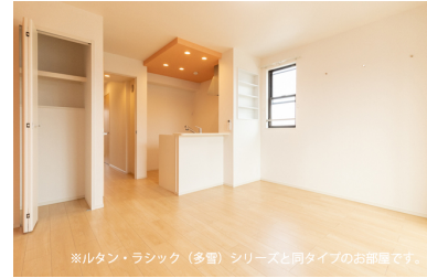
※ルタン・ラシック（多窗）シリーズと同タイプのお部屋です。