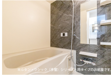
※ルタン・ラシック（多窗）シリーズと同タイプのお部屋です。