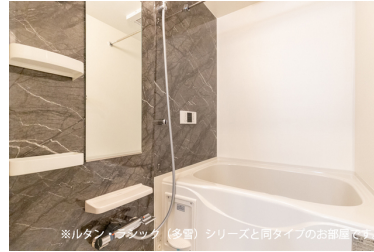
※ルタン・ラシック（多量）シリーズと同タイプのお部屋です。