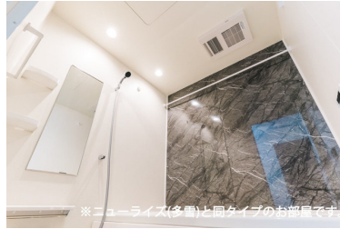
※ニューライズ(多費)と同タイプのお部屋です。