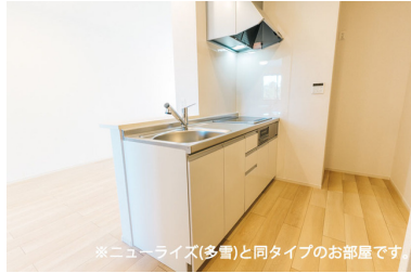
※ニューライズ(多費)と同タイプのお部屋です。