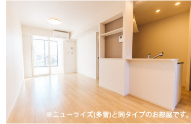
※ニューライズ(多費)と同タイプのお部屋です。