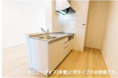
※ニューライズ(多雪)と同タイプのお部屋です。