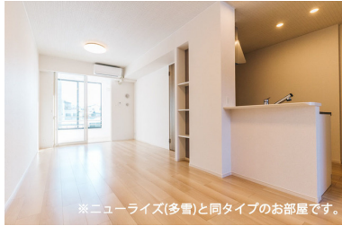
※ニューライズ(多雪)と同タイプのお部屋です。