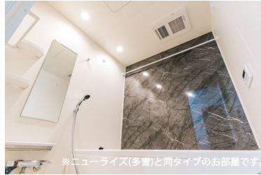
※ニューライズ(多雪)と同タイプのお部屋です。