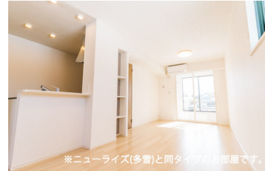
※ニューライズ(多量)と同タイプのお部屋です。