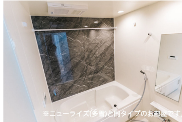
※ニューライズ(多量)と同タイプのお部屋です。