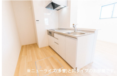
※ニューライズ(多量)と同タイプのお部屋です。