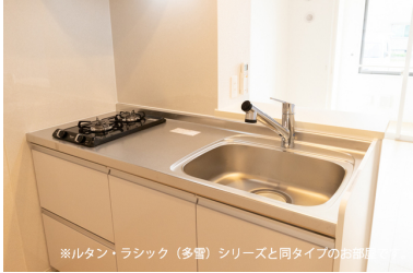
※ルタン・ラシック（多量）シリーズと同タイプのお部屋です。