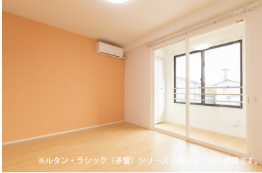
※ルタン・ラシック（多量）シリーズと同タイプのお部屋です。