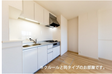
※クルールと同タイプのお部屋です。