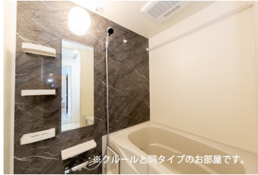
※クルールと同タイプのお部屋です。