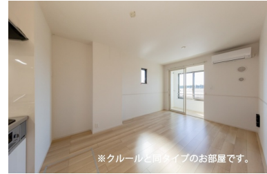
※クルールと同タイプのお部屋です。